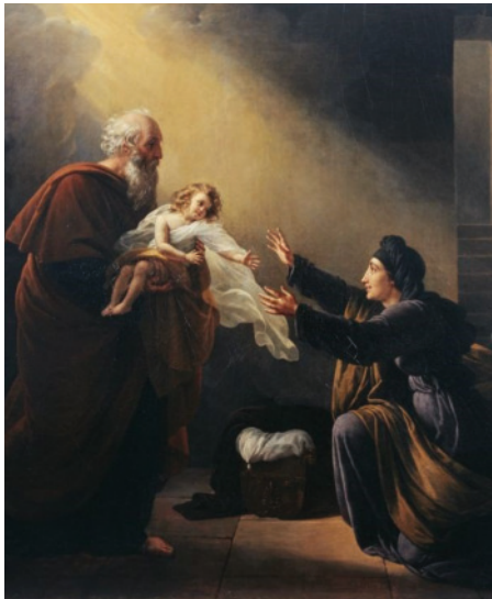
Elias rettet den Sohn einer Wittwe (Gemälde von Louise Mauduit-Hersent, 1819)

Zu Beginn verhängt Elias einen Fluch über Israel, das daraufhin unter einer schweren Dürre leidet. Während sich der Prophet zeitweise zurückzieht, bleibt das Volk sich selbst überlassen. Erst allmählich greift Elias wieder in das Geschehen ein und wirkt an verschiedenen Orten durch Wunder: Er rettet den Sohn einer Witwe und tritt schließlich vor König Ahab, um die Macht Gottes unter Beweis zu stellen.